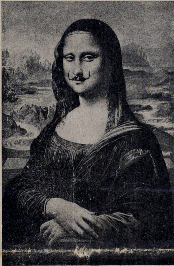
TABLEAU DADA par MARCEL DUCHAMP